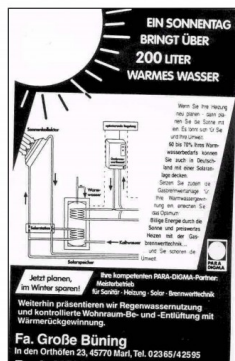
Zweite, spätere und damit falsche Solarwerbeanzeige aus Recklinghäuser Zeitung ab 05.09.1997

In dieser Werbeanzeige ab 1997 fehlen die beiden Werbeslogans aus der Werbeanzeige aus 1996 !! Insbesondere fehlt der Begriff: „ Brauchwasser “