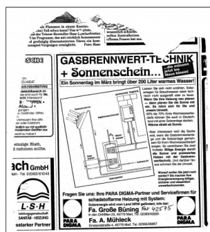
Diese solare Werbeanzeige enthielt noch die zwei Werbeslogans:

„Lassen Sie sich nicht erzählen, Solaranlagen für Brauchwasser seien technisch nicht ausgereift oder zu teuer.“